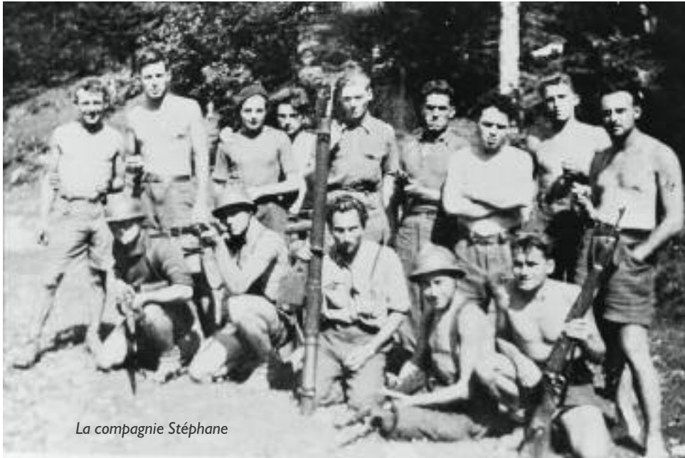
La compagnie Stéphane

Pendant la seconde guerre mondiale de nombreux jeunes français pleins de bravoure se sont engagés dans la lutte contre l'occupant. L'un d'entre eux, habitant notre village depuis de nombreuses années vient de nous livrer son extravagante aventure dans un livre passionnant et émouvant : "Ma résistance dans la compagnie Stéphane" .