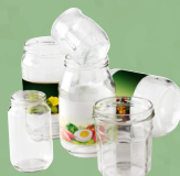
Bocaux de conserve et pots en verre