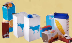
Briques et cartons