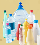
Bouteilles, bidons et flacons en plastique